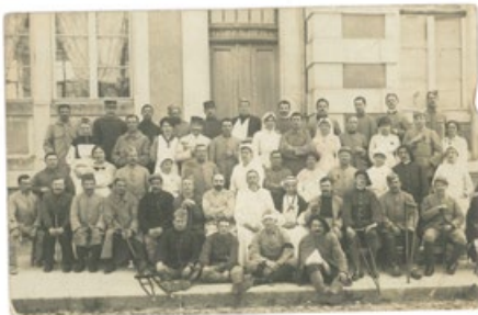
Messes et infirmières devant l'école Saillançonnes