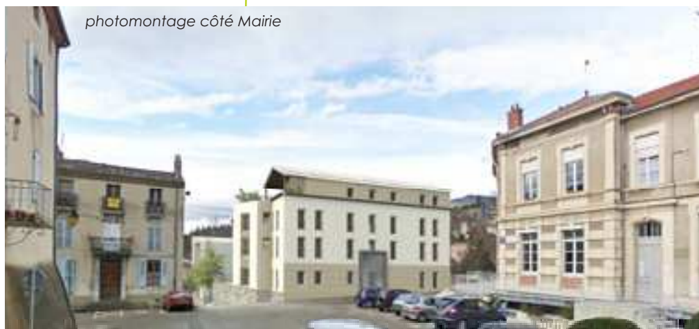
photomontage côté Mairie

Sous les deux immeubles, 26 garages et 7 places de parking seraient créés ; 5 garages seraient réservés pour la Mairie de Saillans et 6 seraient réservés à la location par SDH. Les 15 garages restants seraient à vendre à des particuliers (de 12 000 à 14 000 € TTC). L'accès aux garages se ferait par la calade, avec un sens unique pour la descente et pour la montée.