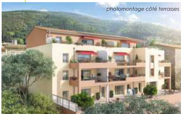
photomontage côté terrasses

L'ensemble des appartements serait adapté aux personnes à mobilité réduite. Le chauffage collectif serait à granulés-bois, relié au réseau communal existant, après convention établie avec la Mairie. Les entreprises retenues pour la construction ont été choisies après appel à candidatures et offres de prix. Elles sont toutes originaires de Drôme/Ardèche.