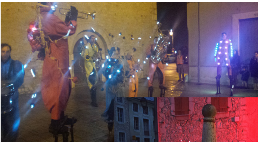
4 mars 2016 Déambulation de La Grosse Couture dans les rues du village