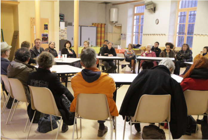
28 février Table ronde «Art contemporain et élitisme» organisée par la Bibliothèque avec la Muse Errante