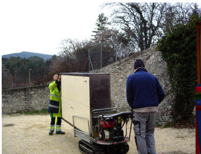
15 février Déménagement des algecos de l'école