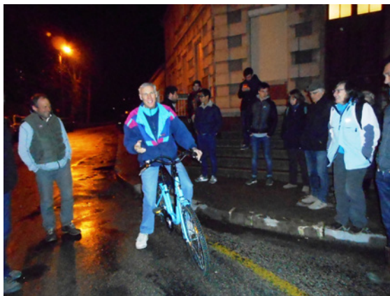
2 mars Projet d'achat groupé de vélos à assistance électrique - essai devant la mairie