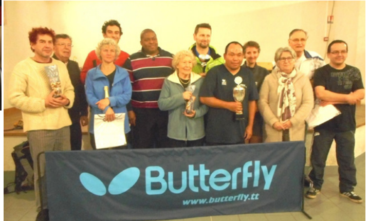
7 février Tournoi de tennis de table à la salle des fêtes, organisé par le Ping Pong Club