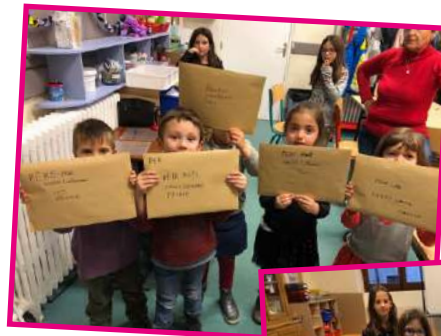
Lettres au Père Noël

Les utilisateurs de la Poste étaient appelés à écrire au "Père Noël" pour maintenir le bureau de poste. Les enfants s'y sont associés gaiement.