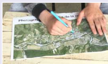
Captures d'écran de la vidéo réalisée avec les jeunes par Jérémie Jorrand et Sarah Jacquet au cours de l'atelier. Elle est visible sur le carnet de bord de la révision du PLU : https://plusaillans.tumblr.com