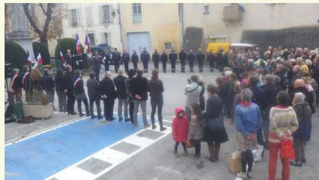
Cérémonie du 11 novembre avec présentation de l'exposition sur les poilus de Saillans