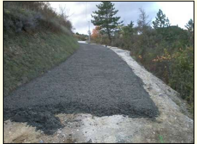
Remise en état du Chemin des Baux (photo durant les travaux)