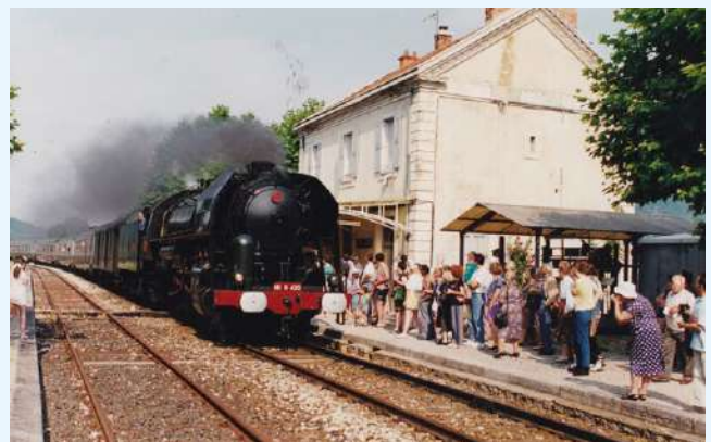
La gare de Saillans en 1994... les trains hors quai ne posent pas de problème !

(synthèse réalisée par Morgane, de Dromolib) ■