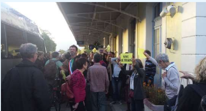
6 novembre, Gare de Die, rassemblement pour s'opposer à la suppression du TER en présence de nombreux saillançons et d'une délégation d'élus !