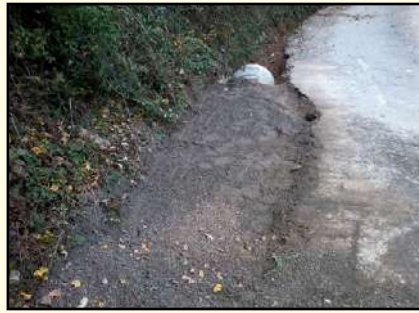
Chemin des Claux - canalisation pour éviter les eaux de ruissellement