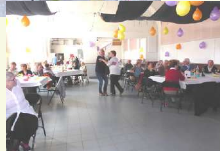
Repas des anciens 2018