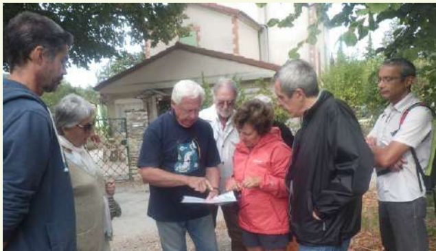
Septembre : Journée du Patrimoine, visite de la bélière