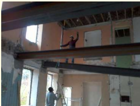
Maison de santé, bientôt un plancher.