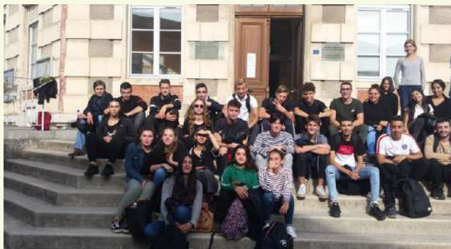
18 octobre - des lycéens du Lycée Aubanel d'Avignon découvrent la mairie et son fonctionnement.