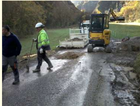
Les travaux pour traiter l'eau potable par Ultra Violet (UVc). Ci-contre la fiche anti-calcaire.