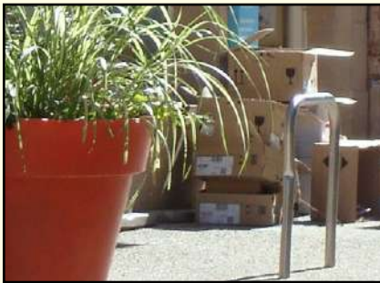
Barre à vélo Grande Rue