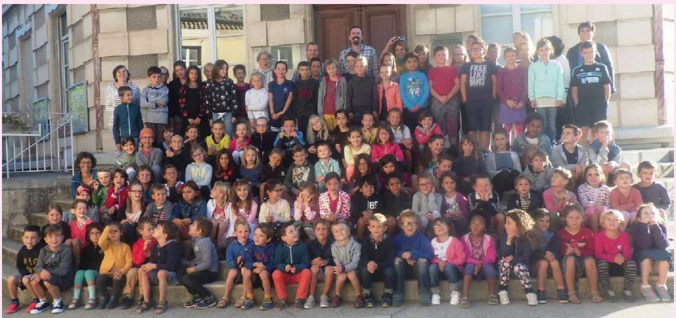
Photo souvenir : c'était la rentrée des 106 enfants de l'école élémentaire

Nous avons pour projet d'accueillir un jeune en service civique à partir de janvier 2019 pour 24h par semaine sur 6 mois sur la thématique "jeux collectifs et jeux de collaboration". ■