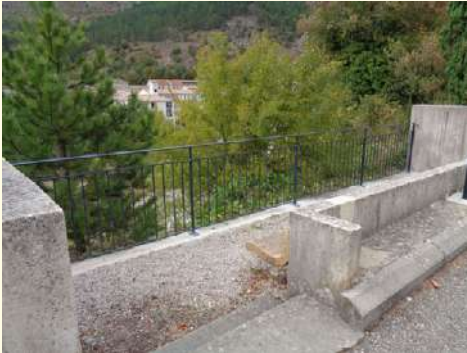
Nouveau garde-corps, chemin d'accès aux Samarins