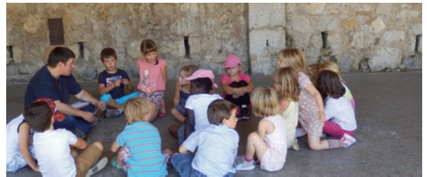
Mardi 2 septembre, rentrée scolaire 2014 et mise en place des TAP à Saillans