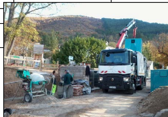
Aménagement des CSE (containers à ordures ménagères semi-enterrés)

Les quartiers des Samarins, de Trélaville, des Chapelains et de l'avenue Coupois en étaient déjà pourvus. Les habitants de la Tuilière auront très prochainement le leur, la commande a été passée.