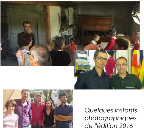
Quelques instants photographiques de l'édition 2016

La prochaine réunion du GAP est prévue le jeudi 16 novembre à 18h30 .